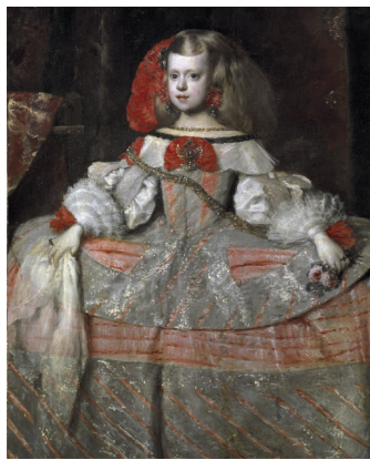
VELÁZQUEZ EN 30 CLAVES